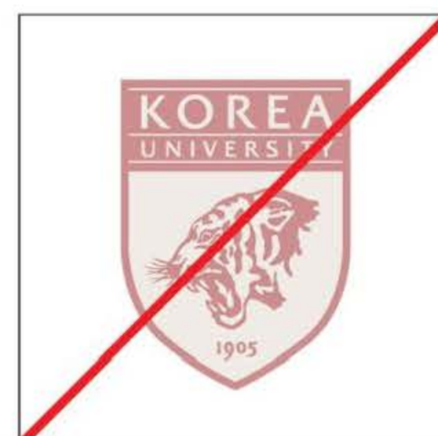
낮은 명도 대비로 선명도가 떨어지는 경우