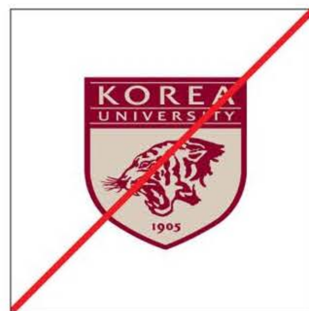
심볼의 형태비례를 임의로 변경한 경우