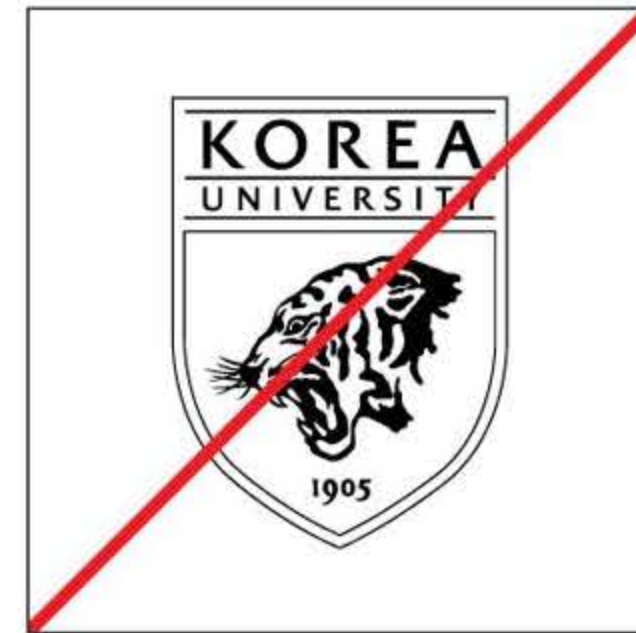
심볼을 라인으로 표현한 경우