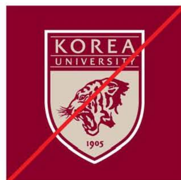
심볼에 테두리를 친 경우