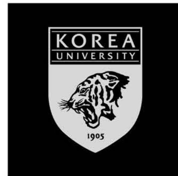
Black 100%, Black 20%