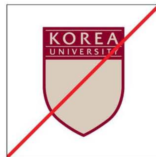
심볼의 요소를 임의로 침삭한 경우