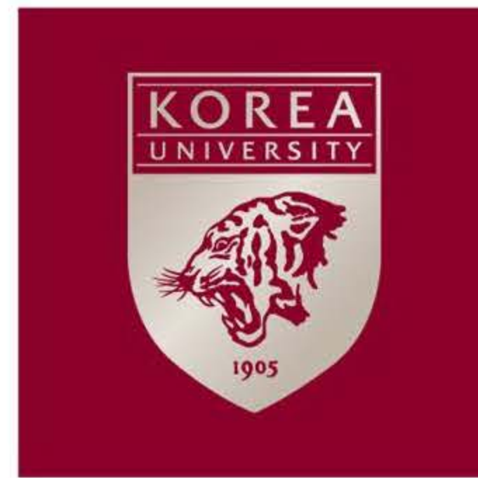
바탕 : Korea University Crimson 심볼 : Korea University Champagne Gold