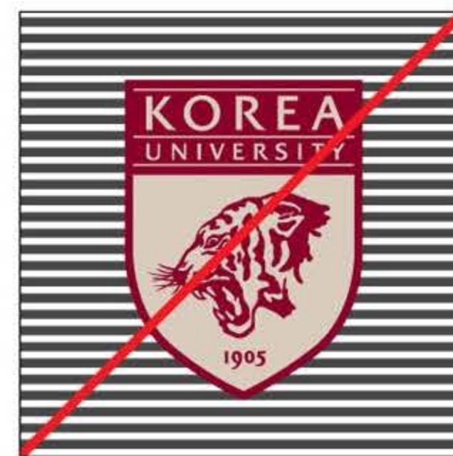
복잡한 배경 위에 심볼을 적용한 경우