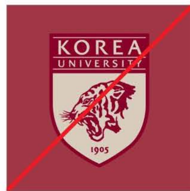
바탕색과 심볼의 구분이 어려운 경우