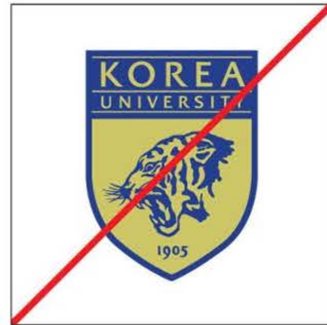
심볼의 색상을 임의로 변경한 경우

이의 변형사용은 고려대학교의 이미지를 왜곡시키거나 커뮤니케이션 효과를 악화시킬 우려가 있으므로 활용시 반드시 규정을 엄수하여야 한다.